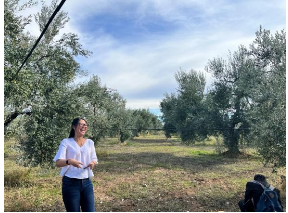
アグリツーリズムへの前途洋々な未来を語る