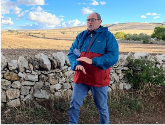
マッセリア・ディダッティカについて熱弁